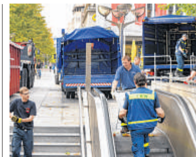
Im Bunker unter der U-Bahn lagern hunderte Betten.

Ein kleineres Vorhaben steht kurzfristig an. 200 bis 300 Quadratmeter Fläche sucht ein baden-württembergisches Unternehmen in Duisburg. Schon für Freitag wurde ein Besichtigungstermin für eine geeignete Duisburger Immobilie vereinbart.