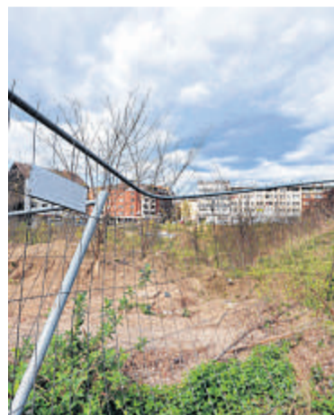
Die Langzeit-Brache an der Steinschen Gasse.

Die Unternehmensgruppe Hoff ist ein 1964 gegründetes Familienunternehmen mit Erfahrungen im Bau von Handels-, Wohn- und Büro- und Mit Kunden von Bertelsmann bis RAG (Ruhrkohle). Ähnliche Projekte wie jetzt an der Steinschen Gasse habe man bereits realisiert, sagte Bielke, der mit Spannung dem neuen Vorhaben entgegen sieht: „Die Altstadtlage hat uns sehr gereizt.“ Mit den Planungen will er im kommenden Jahr fertig sein.