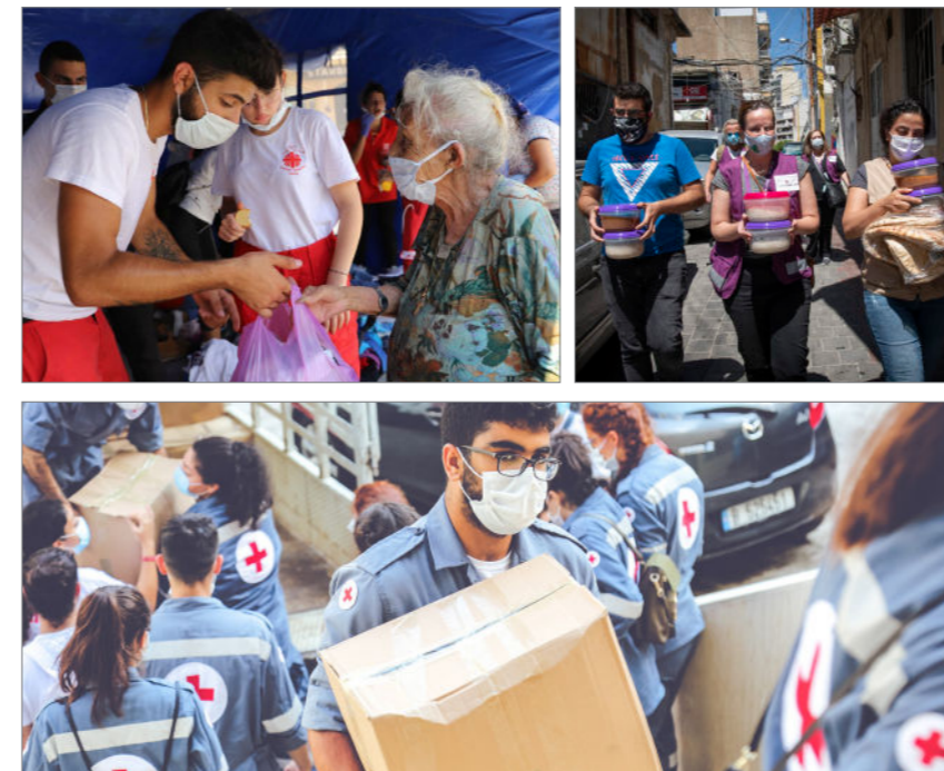
© UNICEF | Dominique Mann von EWDE e. V. Brot für die Welt | Beirut 2020

Über das Aktionsbündnis Katastrophenhilfe haben wir den Hilfsorganisationen vor Ort, die mit ihrer Arbeit die betroffenen Menschen dort unterstützt haben, Spenden in einer Gesamthöhe von 10.000 Euro zukommen lassen.